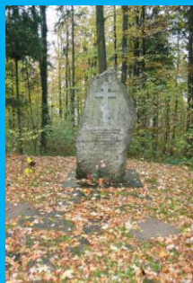
Православный крест и гранитная скала, установленные на месте захоронения 2000 русских солдат и офицеров армии А.В.Суворова

самых старых русских военных кладбищ на территории Германии;