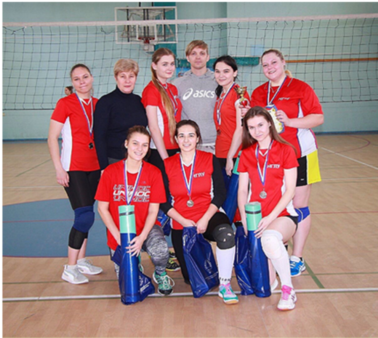
Соревнования администрации Нижегородского района

Многие спортивные игры имеют свои дни рождения. Особенно это касается популярных видов спорта, имеющих по всему миру много поклонников. 9 февраля именинником стал волейбол.