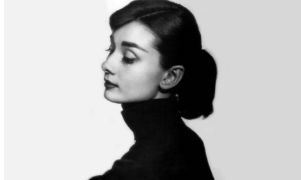
ИЩИТЕ ЖЕНЩИНУ СТР. 5