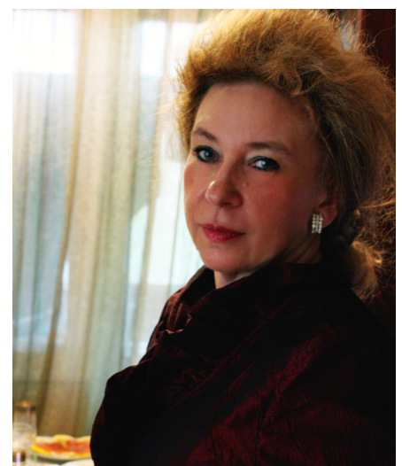
(продолжение на 4 стр.)