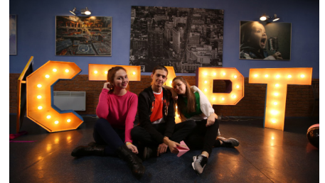
СТАРТУЕМ СТР. 6