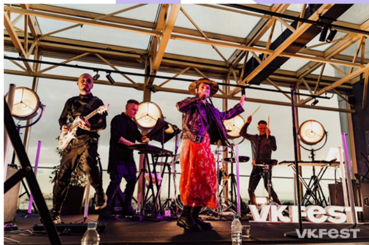
IOWA на онлайн-фестивале VK Fest 2020