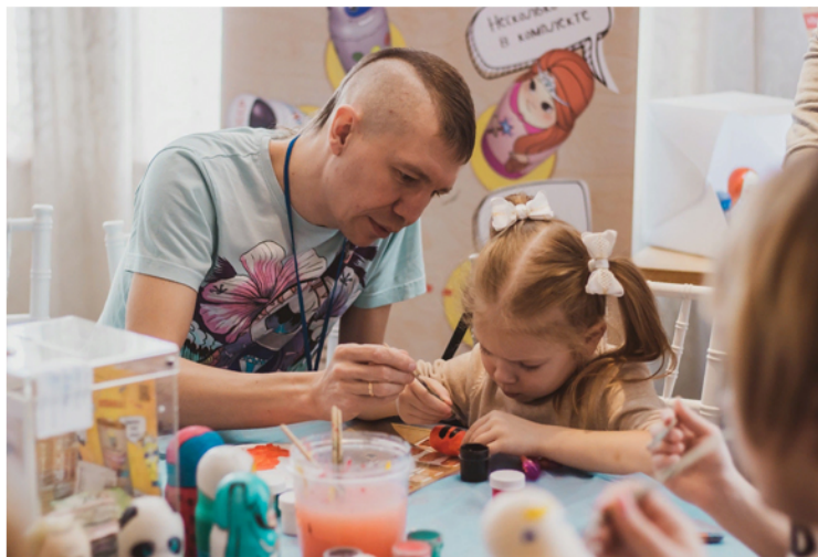
Благотворительный фестиваль «Красивое счастье»

На сегодняшний день благотворительный сектор нашей страны работает в режиме чрезвычайной ситуации. Помощь от волонтеров перестает поступать в детские дома и приюты для животных. Как пандемия коронавируса повлияла на работу благотворительных фондов Нижнего Новгорода? Об этом мы узнали у представителей фондов «Дети без мам», «Сострадание НН» и «Ночлежка».