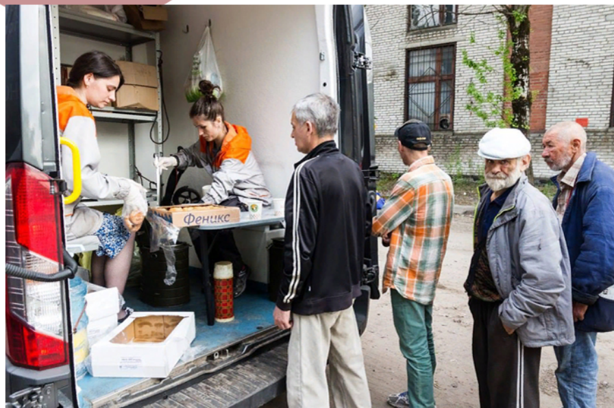
«Ночлежка» раздает еду бездомным