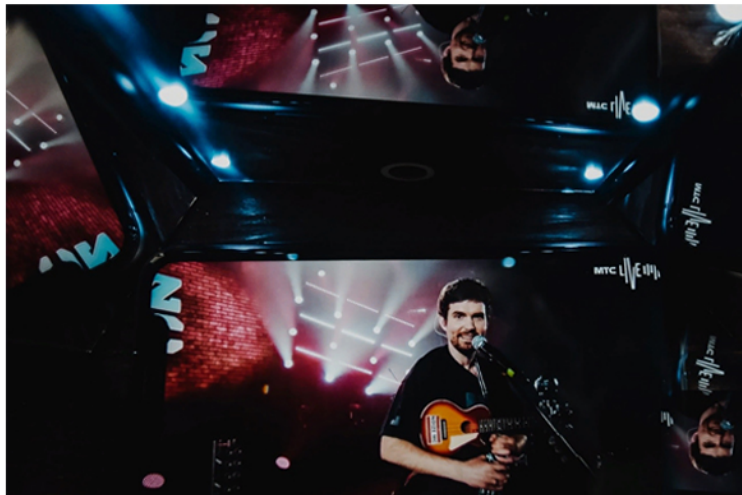
Онлайн-концерт Noize MC на MTC Live от 16.05

Что делать, если уже выучил 5 языков, пересмотрел все сериалы, а в книжном шкафу не осталось ни одной непрочитанной книги? Сейчас очень много сервисов транслируют концерты популярных исполнителей, а сами артисты проводят прямые эфиры в Instagram. Среди всего этого многообразия мы выбрали самое лучшее и готовы поделиться с вами.