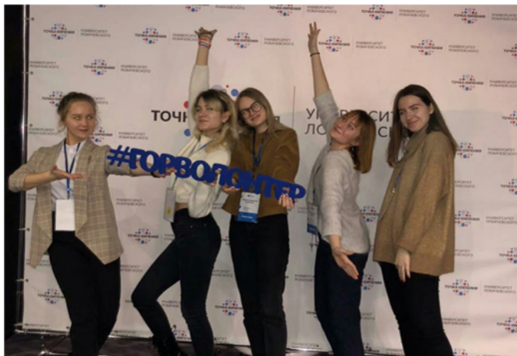
Школа городского волонтера

— Обязательно должно быть желание! Всему остальному можно научиться. В частности мы научим, все покажем, расскажем. Поэтому да, волонтером может стать любой желающий!