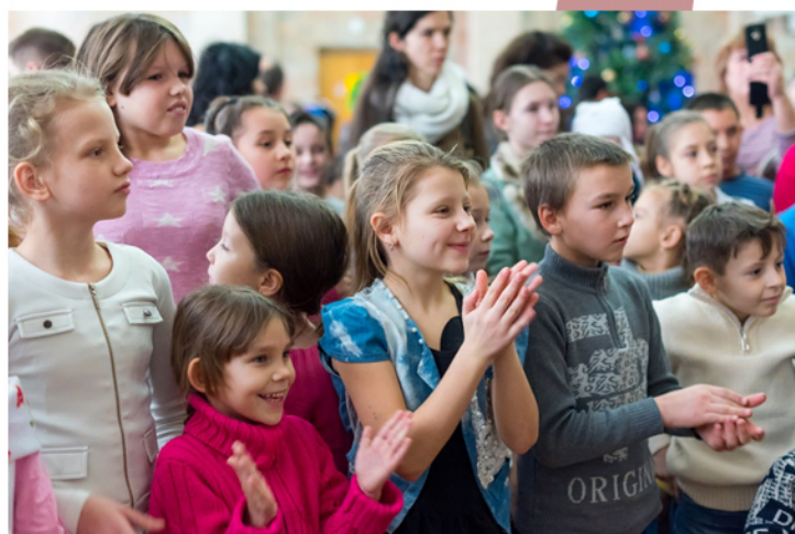
Праздник, организованный фондом «Дети без мам»

Благотворительный фонд «Сострадание НН» содержит приют на 250 собак и кошек. Животных воспитывают, дрессируют, выхаживают и