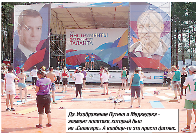
Да. Изображение Путина и Медведева - элемент политики, который был на «Селигере». А вообще-то это просто фитнес.

На лекциях не всегда было интересно (скажу по секрету, в родном инязе они увлекательнее), а т.к. мы сидели на полу с вытянутыми или согнутыми ногами, часто болела спина, но это только повышало нашу самодисциплину.