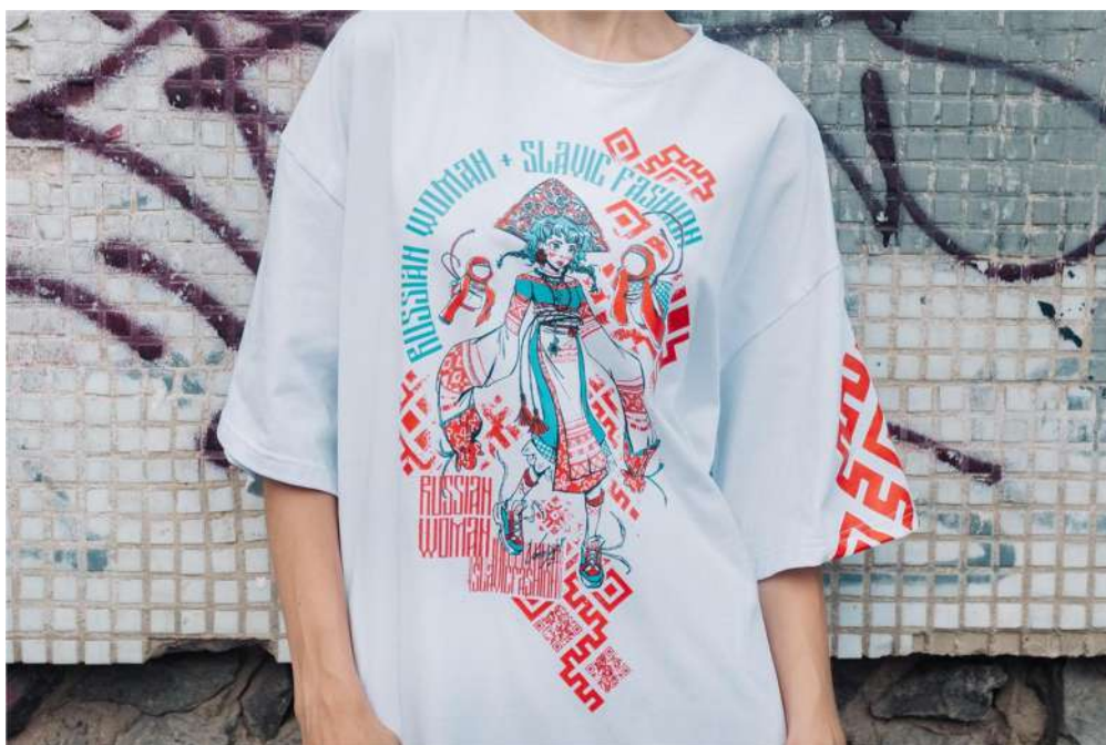
Рис. 3.2. Футболка бренда Beautiful Criminals , на которой стилизованно изображена русская красавица в обрамлении надписей на кириллице голубого и красного цвета («русская женщина + славянская мода») [25]