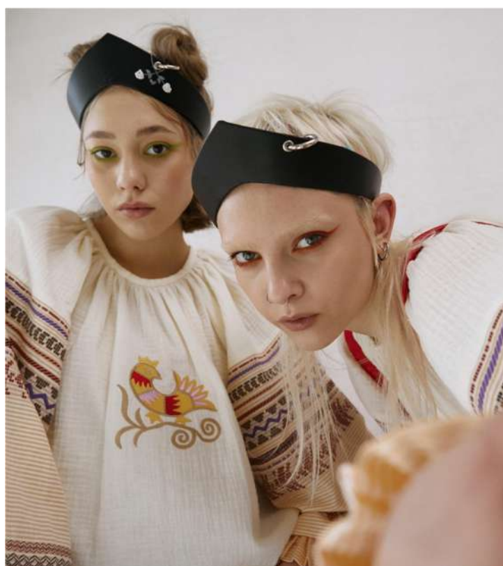
Рис. 3.5. Кокошники бренда Beautiful Criminals [28]

современном мире не пользуются большим спросом, некоторые из перечисленных ремёсел и вовсе утратили своё практическое значение. И мы неизбежно сталкиваемся с вопросом о необходимости поддержки оставшихся ремесленных центров. С одной стороны, вряд ли кто-то из городских жителей будет пользоваться лаптями как обувью, а дети будут играть глиняными и деревянными игрушками, с другой – эти изделия покупают в качестве сувениров в память о месте, которое ранее славилось народным промыслом. Поэтому в лучшем положении находится производство украшений и аксессуаров в традиционном стиле. В последнее время, например, пользуются популярностью кокошники – небольшие по размерам, лаконичные и чёрного цвета, делают их из кожи (см. рис. 3.5). Они выглядят стильно, подчёркивают индивидуальность и в то же время напоминают о традиционном головном уборе наших предков, о наших корнях.