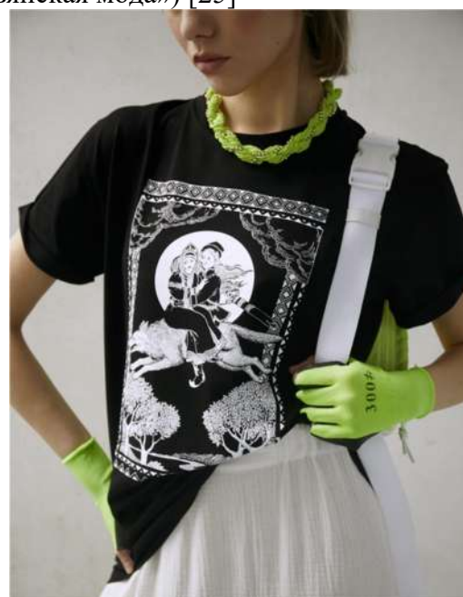
Рис. 3.3 и 3.4. Футболки бренда Beautiful Criminals , на которых изображены герои русских народных сказок [26; 27]

Музыка сопровождает человечество на протяжении всей его истории развития и всегда имела огромное значение в духовном, эстетическом, нравственном развитии человека, а слух наряду со зрением является одним