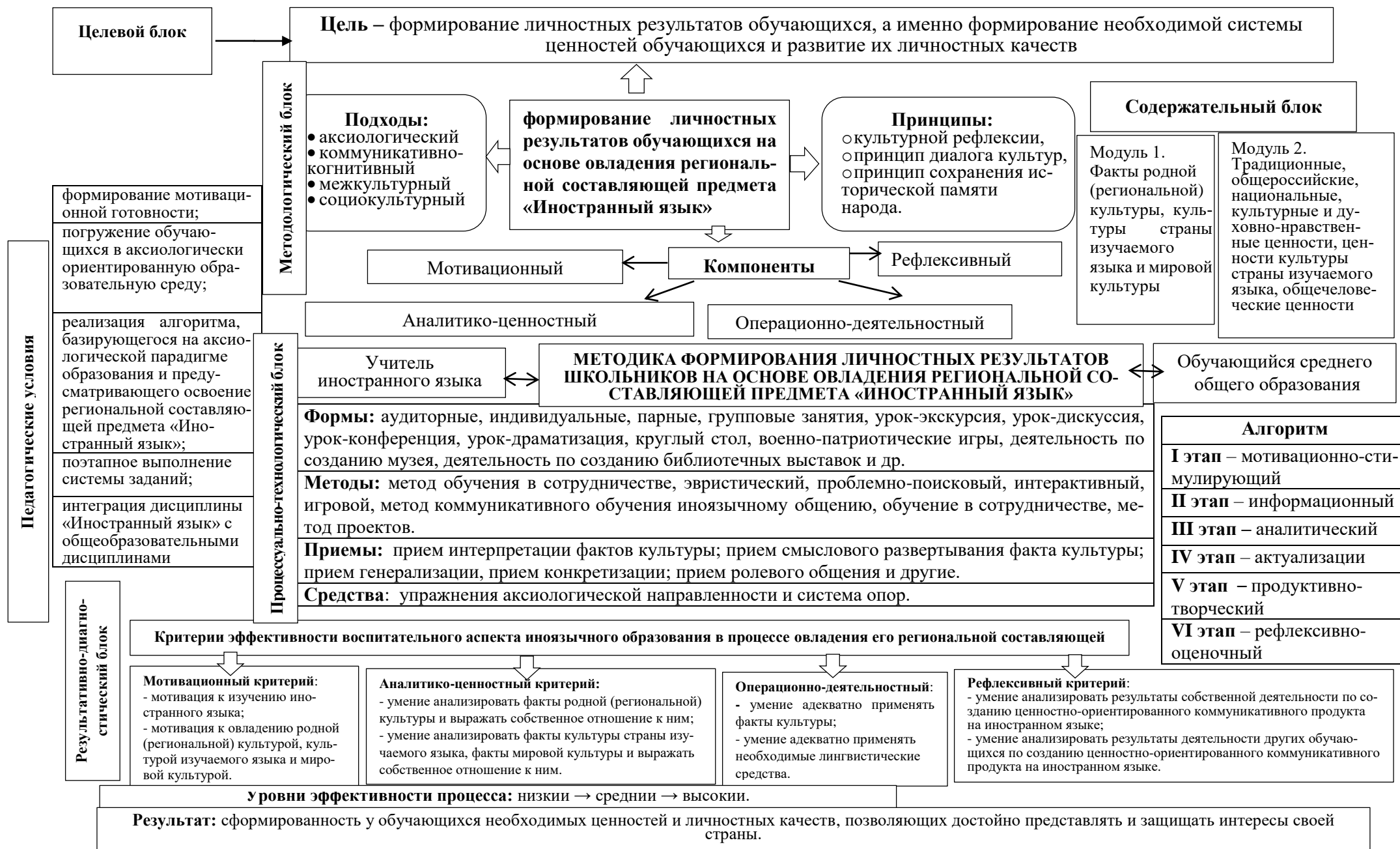
Рисунок 1. Модель формирования личностных результатов школьников на основе овладения региональной составляющей на занятиях по иностранному языку